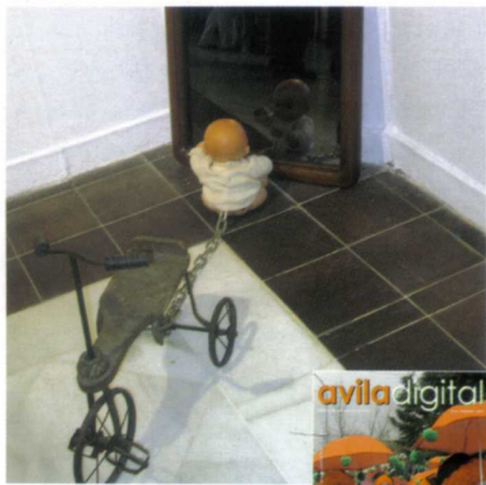
Obra de Luis Miguel Luján del Río

E l porcentaje habitante-artista en esta ciudad castellana puedo pensar que superará con creces la media nacional, sin duda. No es ahora el momento de analizarlo, pero sería interesante la valoración de este fenómeno, que no radica solamente en la secular belleza de Ávila, su gigantesco patrimonio cultural y la "inmersión" estética que impone en sus ciudadanos.