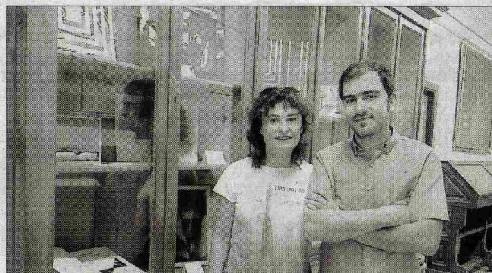
Los artistas con algunas de sus obras.