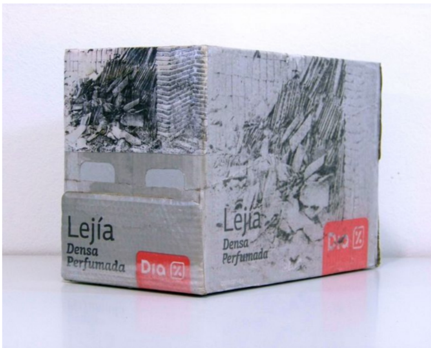
Juan Gil Segovia, Bleach , 2018

Piace al pubblico, e perciò si ripete per il terzo anno, l'originale iniziativa di Hybrid Art Fair, piccola rassegna montata negli spazi del Petit Palace Hotel, in plaza Santa Barbara. Solo nel primo weekend di marzo si potrà gustare un'esperienza intima e accogliente nelle stanze d'albergo trasformate per l'occasione in piccole gallerie. Tra i corridoi e le scale del palazzo saranno invece allestite opere d'arte effimere, site specific. Trentacinque le gallerie partecipanti, provenienti da tredici Paesi, ma soprattutto interessante sembra essere il dibattito sui nuovi modelli di gestione e sullo scenario contemporaneo dell'arte indipendente, proposto nei Talking Independent. Tra gli espositori, anche gli italiani Studio 38 Contemporary Art Gallery (Pistoia), Ufo Fabrik (Trento) e Eggers 2.0 (Torino).