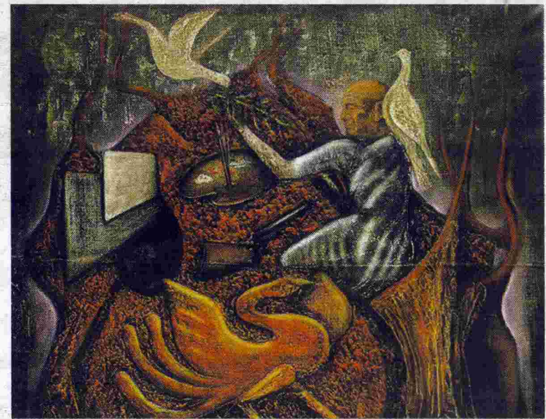
'Situación concreta del genio', de José Antonio Arribas. / FIRMA