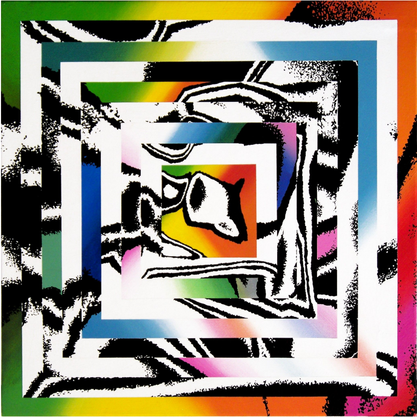
ESPACIO GEOMÉTRICO, 2014. Acrílico sobre tela, 62 X 62 cm.