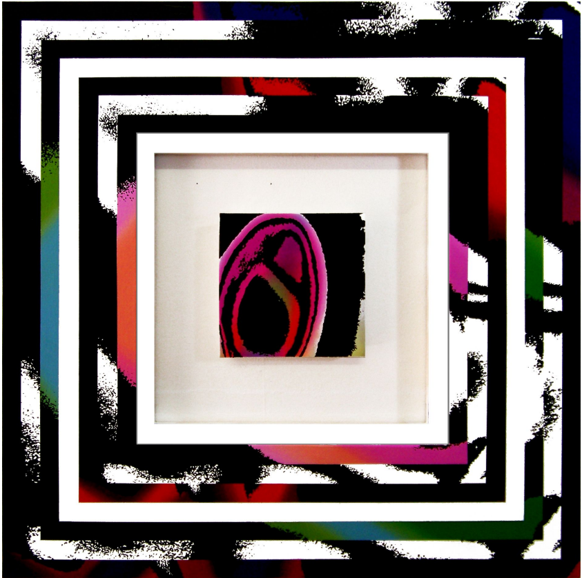
ESPACIO GEOMÉTRICO, 2014. Acrílico sobre tela. 100 X 100 cm.