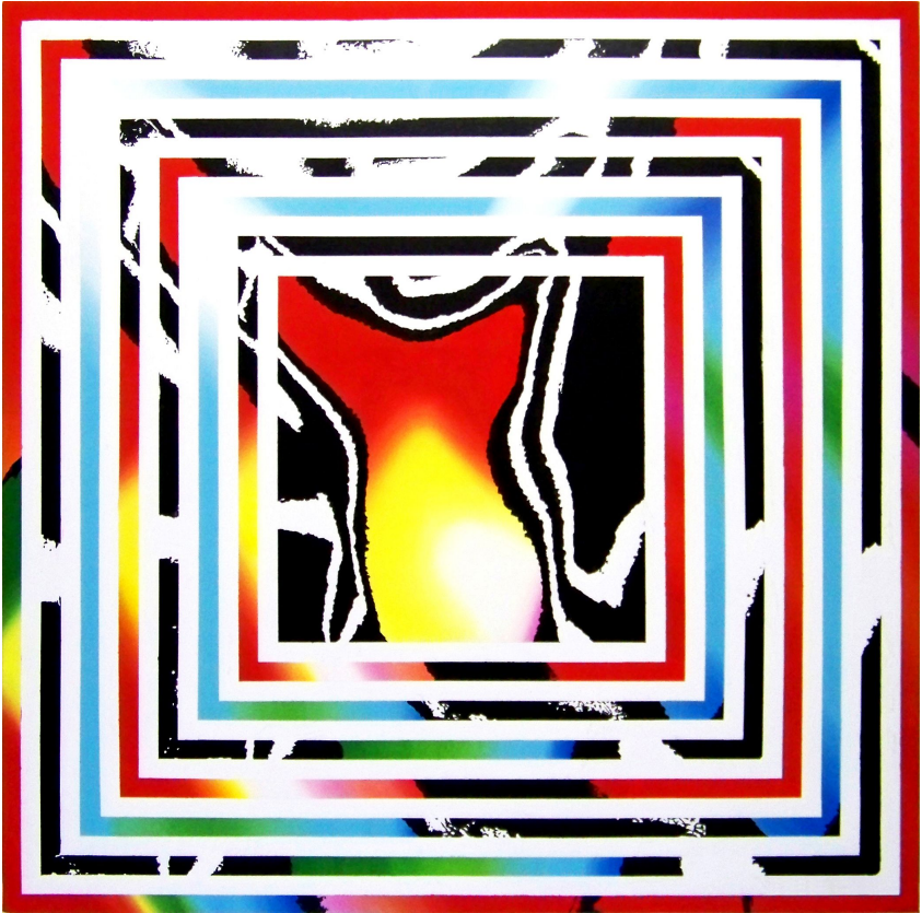
ESPACIO GEOMÉTRICO, 2013. Acrílico sobre tela, 116 X 116 cm.